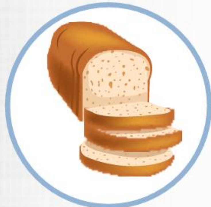
Pan tostado o sin tostar