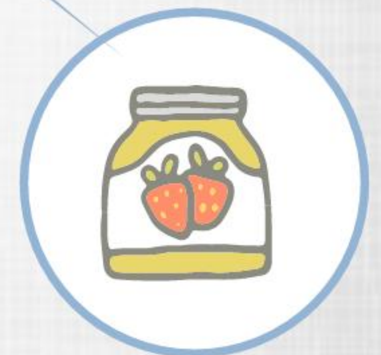
Mermelada de fruta melocotón, fresa, etc.