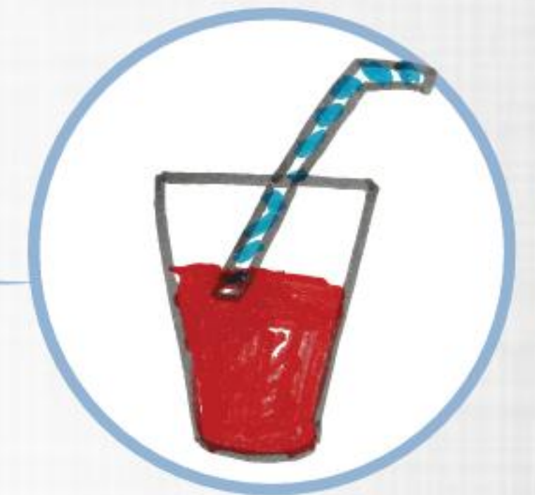
Zumo naranja o de otra fruta