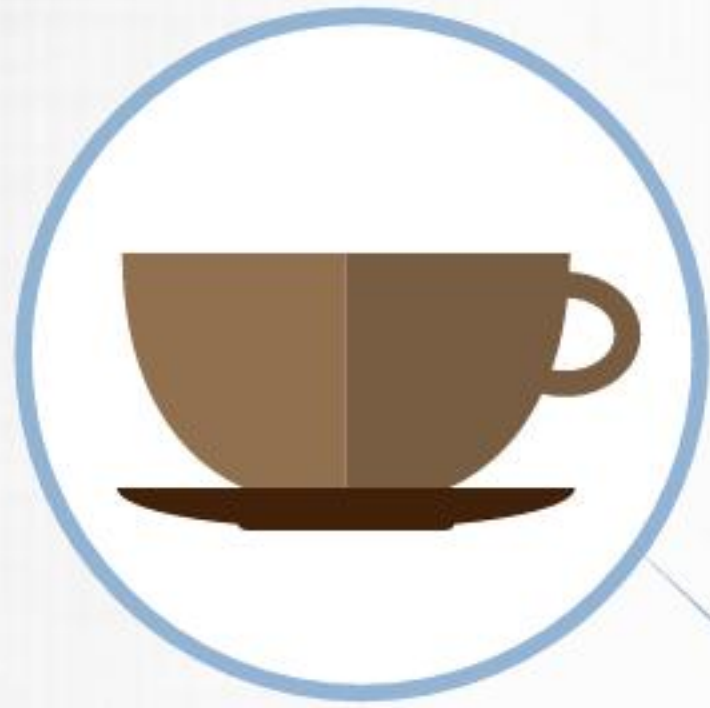
Café, té o chocolate